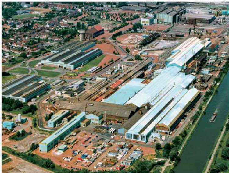
L'imposant site Aperam génère une chaleur aujourd'hui perdue qui pourra bientôt être réutilisée : économique et écologique. Au total, 2 100 salariés y travaillent.