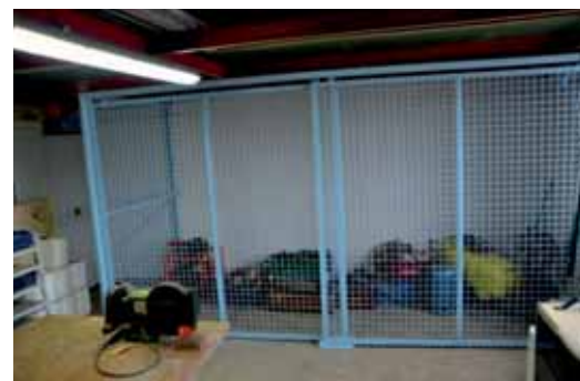
Aménagement d'un local de rangement aux services techniques