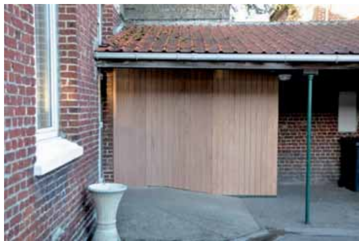
Habillage du local rangement salle polyvalente