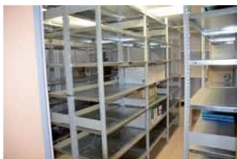
Aménagement salle des archives à la mairie