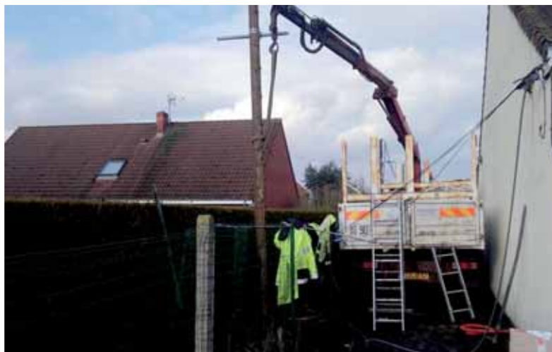
Remplacement d'un poteau électrique à l'école Daudet Perrault