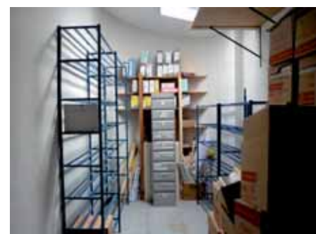
Aménagement local archives ancienne mairie