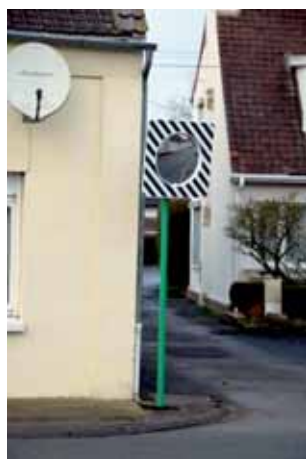
Sécurité : mise en place de 2 miroirs Place St Nicolas et sortie des Services Techniques