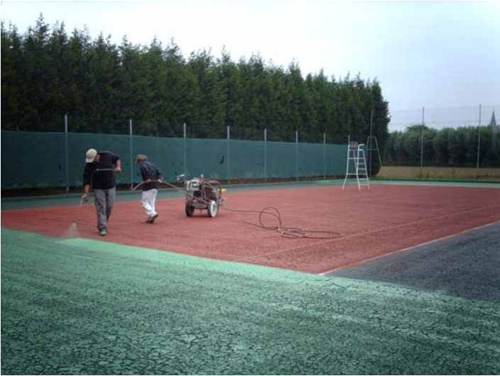
Réfection du court de tennis