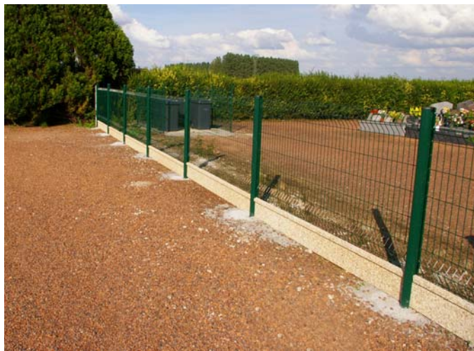
Clôture au nouveau cimetière