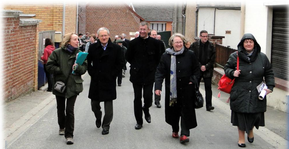
Découverte du village de Liettes