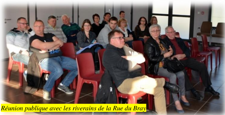
Réunion publique avec les riverains de la Rue du Bray