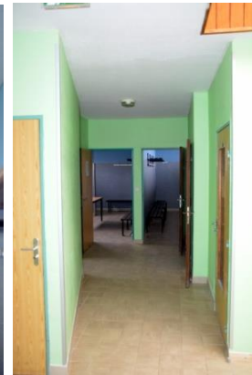
Remise en peinture des vestiaires du terrain de football