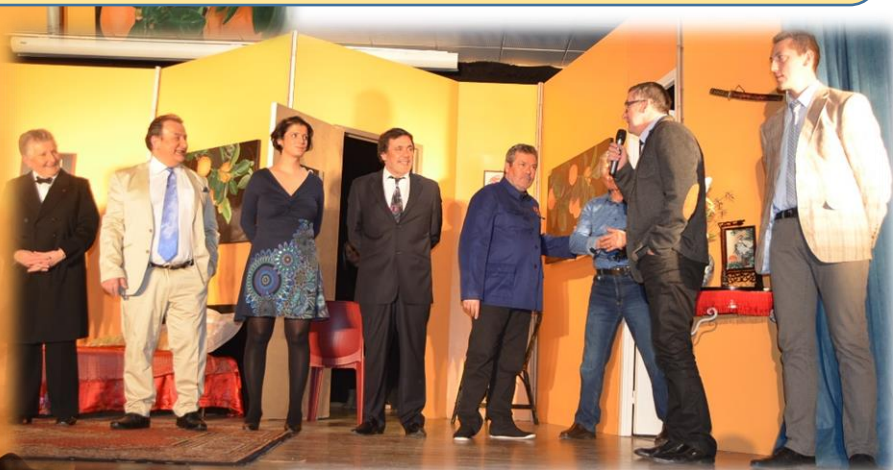
Pièce de théâtre : « la chambre mandarine » interprétée par la compagnie Boulevard d'Arras