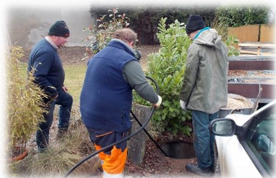
Hydrocurage rue du petit Carluy

La société Ducrocq TP a emporté l'appel d'offre concernant le busage des fossés de la rue du Bray. Le démarrage des travaux est prévu mi-avril. Une réunion publique avec les riverains aura lieu avant le chantier pour expliquer le déroulement de celui-ci.