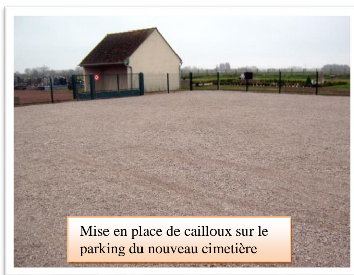
Mise en place de cailloux sur le parking du nouveau cimetière